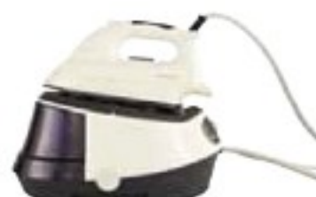
Singer SP2027 dostatečně (35 %), 2560 Kč