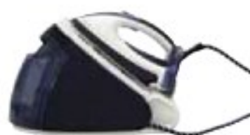
Philips GC9222/02 PerfectCare Expert dobře (73 %), 7000 Kč