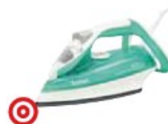
Tefal FV3810 Supergliss dobře (68 %), 850 Kč