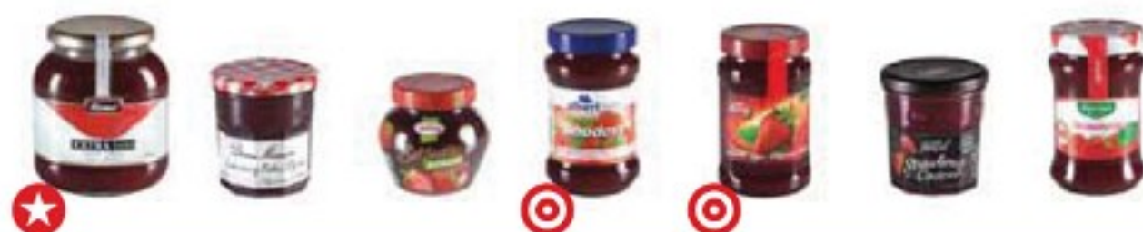
jahodové džemy výběrové (Extra)