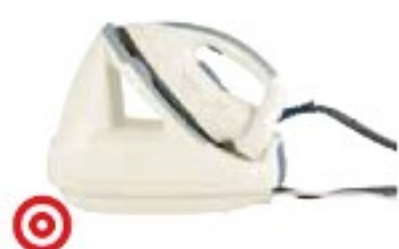
Tefal GV5245 Easy Pressing dobře (68 %), 2970 Kč