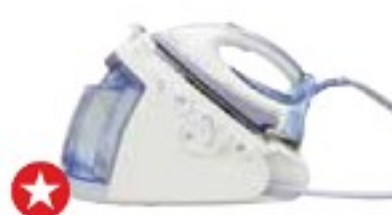
Philips GC9550/02 PerfectCare Silence dobře (76 %), 9800 Kč