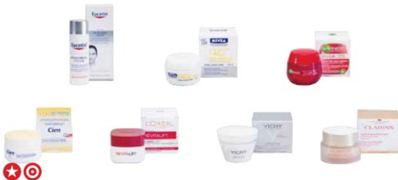
denní krémy proti vráskám