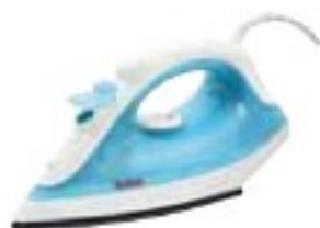
Tefal FV1215 Inicio dobře (65 %), 650 Kč