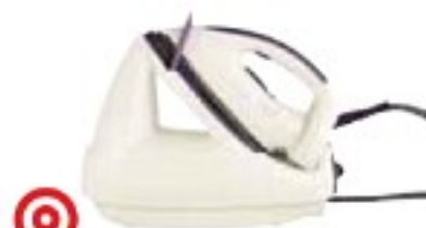
Tefal GV5225 Easy Pressing dobře (68 %), 2770 Kč