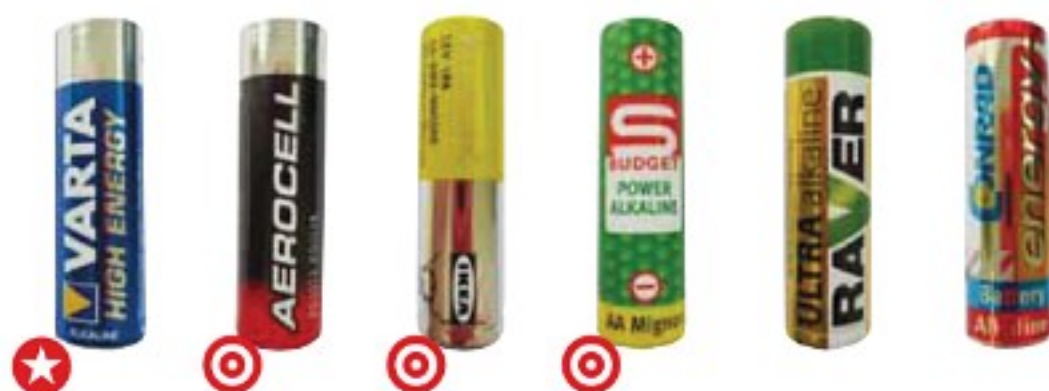
alkalické baterie tužkové (AA)