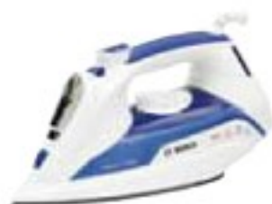
Bosch TDA5028010 SENSIXX DA50 dobře (74 %), 1350 Kč