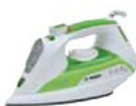
Bosch TDA 502411 E uspokojivě (59 %), 1350 Kč