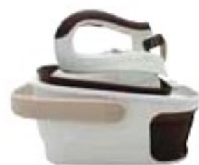
Domena EasyBox Neo dobře (71 %), 6990 Kč