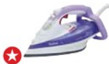
Tefal FV5335 Aquaspeed Time Saver 30 velmi dobře (80 %), 1250 Kč