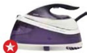
Philips GC7635/30 PerfectCare Pure dobře (78 %), 5000 Kč