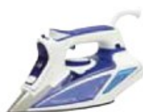
Rowenta DW9220 Steamforce dobře (72 %), 2220 Kč