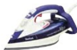
Tefal FV5370 Aquaspeed Time Saver 70 dobře (78 %), 1800 Kč