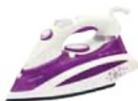
Sencor SSI8441VT dostatečně (37 %), 500 Kč