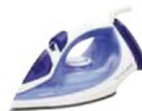
Philips GC2046/20 EasySpeed Plus uspokojivě (55 %), 900 Kč