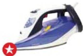
Philips GC4914/20 PerfectCare Azur velmi dobře (80 %), 2290 Kč