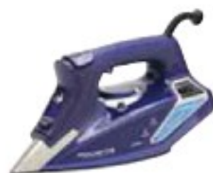
Rowenta DW9240 Steamforce uspokojivě (52 %), 2550 Kč