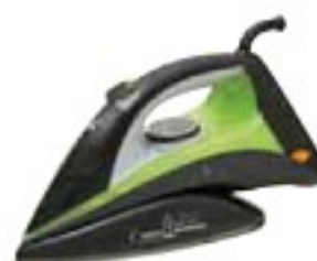
Eta Viento 6284 dobře (68 %), 1600 Kč