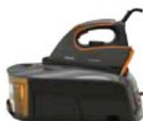
Siemens TS22XTRM dobře (74 %), 5550 Kč