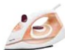
Philips GC1905/02 1900 series uspokojivě (56 %), 570 Kč