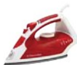
Electrolux EDB5115RP dostatečně (36 %), 1020 Kč