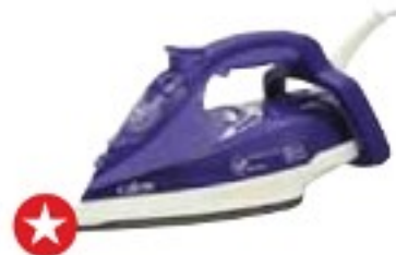
Tefal FV9625 Autoclean Anti-Calc 25 velmi dobře (80 %), 1730 Kč